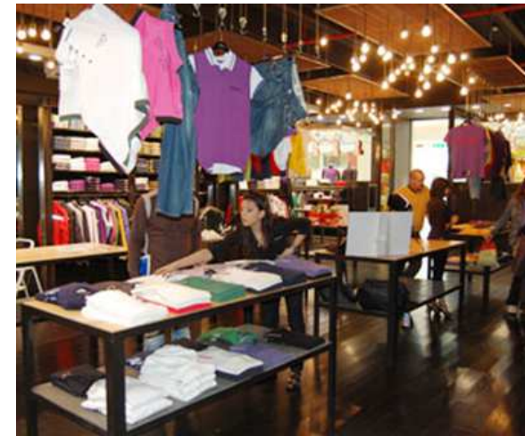
C.C. Tiburtino - Roma