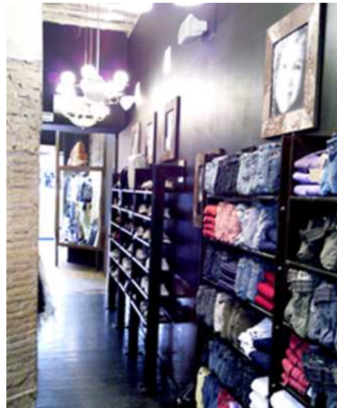
Via del Corso - Roma